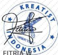
FITRIA W Founder KREATIST.ID

Yang telah mengikuti PELATIHAN FOTOGRAFI 3in1 Kreatist.ID, dengan ini kami menyatakan bahwa yang bersangkutan telah memahami basis dan teknik dasar dalam Fotografi.